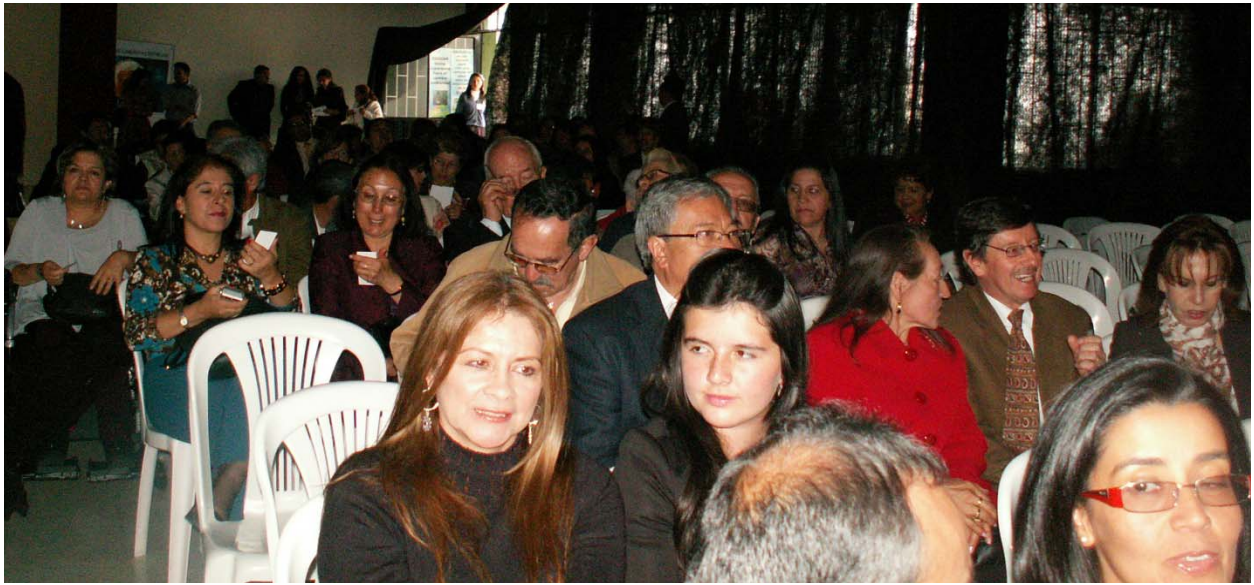
En las fotos anteriores se pueden apreciar aspectos de la concurrencia.