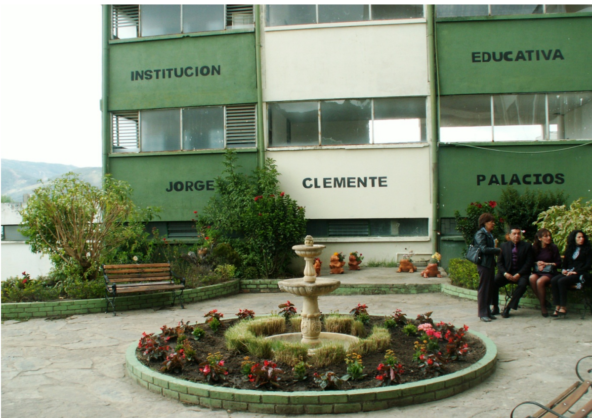
En el salón principal del colegio se llevaron a cabo los actos del lanzamiento y los adicionales, como los discursos alusivos y los reconocimientos hechos al Dr. Palacios. Estas imágenes muestran el exterior y el interior de las instalaciones de la institución.