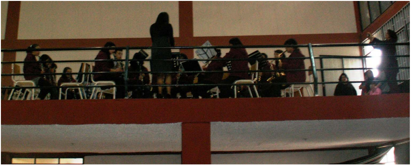
La banda musical juvenil de Tibasosa deleitó a los presentes con su intervención en uno de los intermedios.